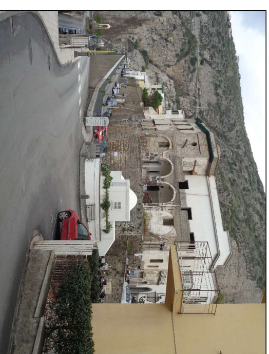
foto 1: veduta di Piazza Ascensore da via A. Cosenza con al centro il fabbricato