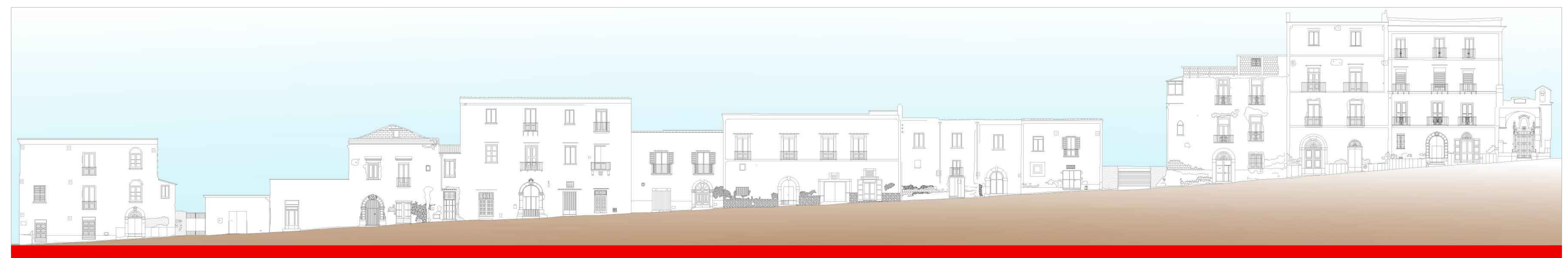
Profilo 4- via Vocale a Nord