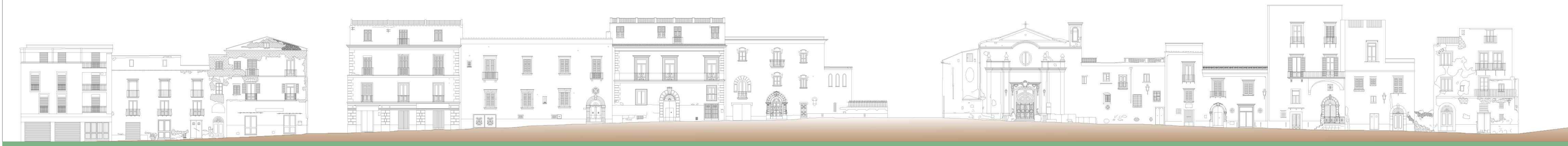
Profilo 1- dal casale a via C. Colombo lato a Monte