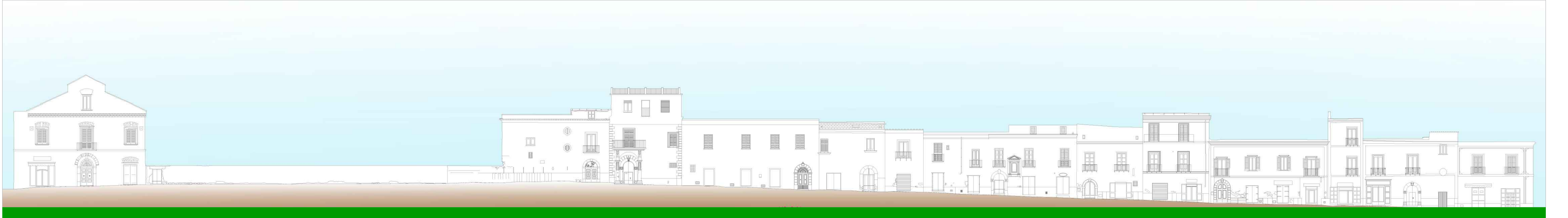
Profilo 2- via Cosenza al casale lato a valle